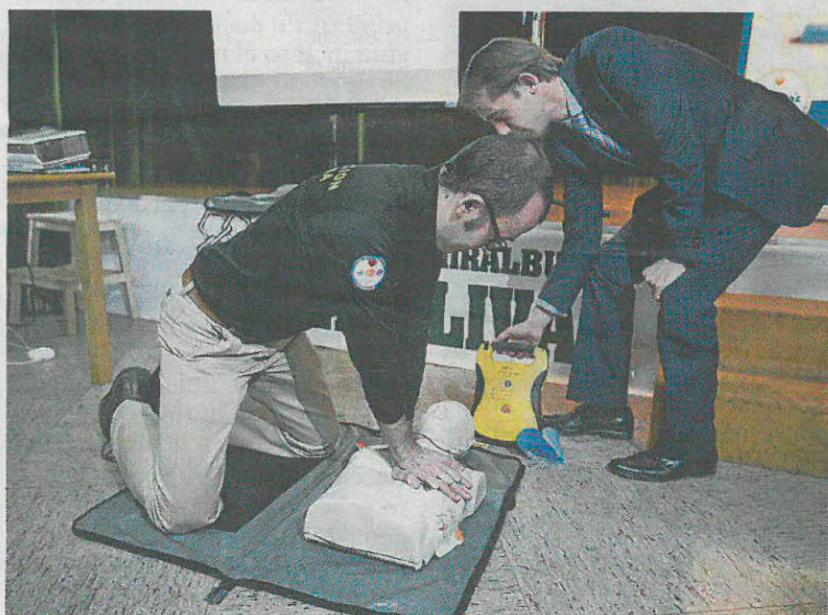
Demostración de primeros auxilios, ayer en el Olivar. ASIER ALCORTA